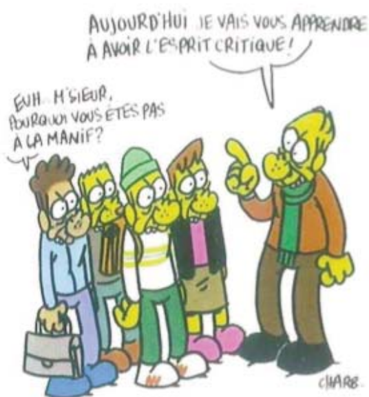
Les images de Charb pour la FSU